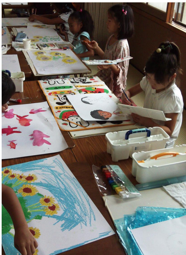
南新屋会館にて奮闘中